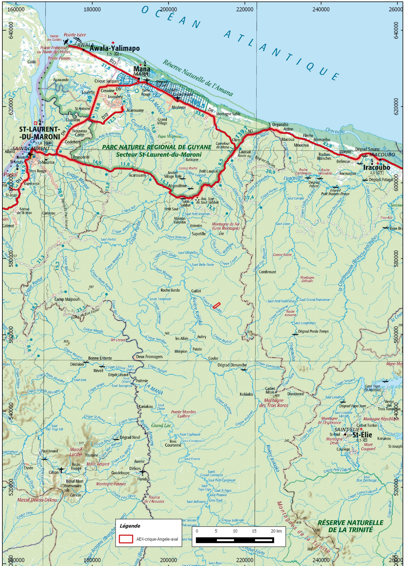
Carte de situation de l'AEX « crique Angèle aval » de la SARL PMJ sur la commune de Mana sur un fond de carte IGN au 1/500 000° en RGF95 UTM22